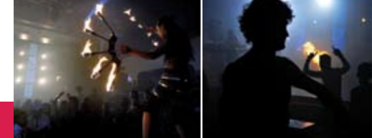
BOVEN: SUPERGAY OP PATROUILLE. LINKS: BOUW- EN BEELDEN-KUNST IN MEXICO CITY. ONDER: HEET FEEST – VELVET.

EEN ONTROOSTBARE MOEDER VERTROUWT SUPERGAY TOE DAT ZE VAN DE DAKEN WIL SCHREEUWEN DAT HAAR ZOON – DIE MET EEN HANDDOEK GEWURGD WERD AANGETROFFEN IN EEN HOTELKAMER – HOMO WAS.